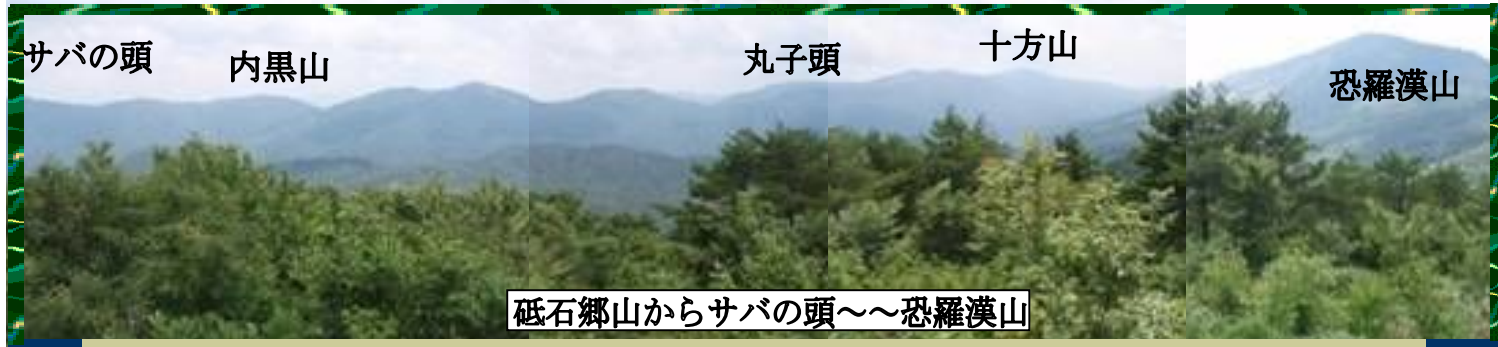
砥石郷山からサバの頭~~恐羅漢山