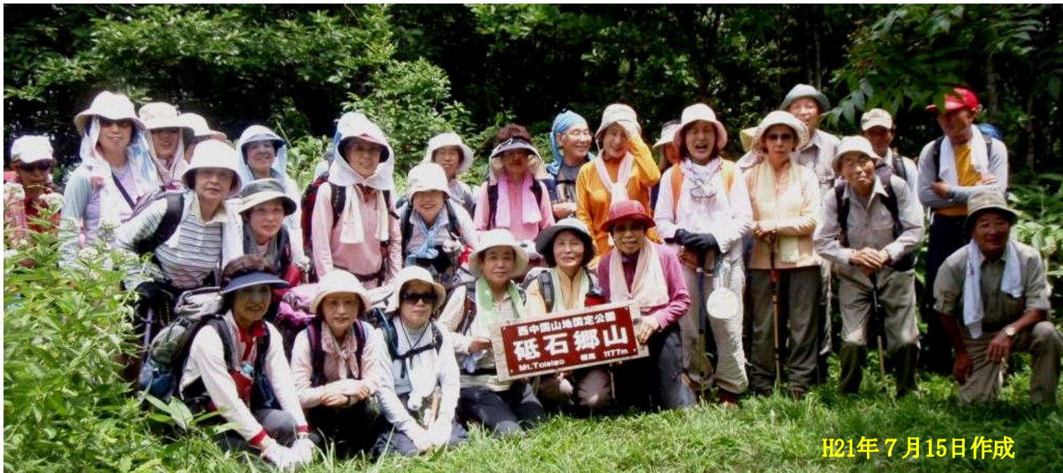
西中国山地国定公園 砥石郷山 Mt. Toisiao 標高 1177m