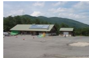
センターハウスから砥石郷山