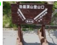
センターハウス下山口