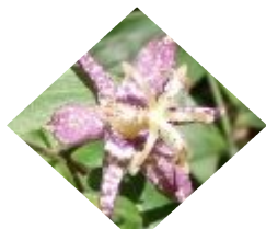
ヤマジノホトトギス