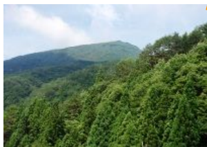
田代から砥石郷山